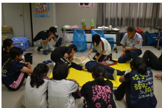
AEDを使った心肺蘇生法の実技

8月8日（木）紀の川市の防災ジュニアリーダーのみなさんが育成講座の一環で防災センターを訪れ普通救命講習を受講しました。