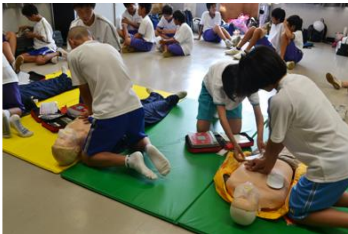
普通救命講習会風景（AEDを使った心肺蘇生法の実技）

普通救命講習会では、恥ずかしくて声が小さい子ども達。しっかりと手順を覚えて人助けに役立ててほしいですね！