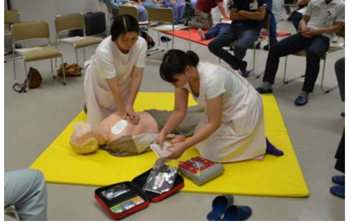
AEDを使った心肺蘇生法の実技