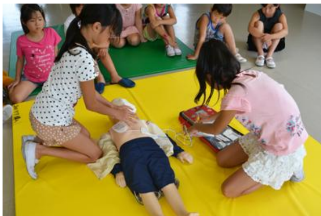
AED の使用方法を学ぶ

8月4日(日) 8月18日(日)に子ども防災博士応急手当講座を開催しました。この講座は、認定講座を受講した児童を対象に、応急手当の知識や技術を学ぶ講座です。