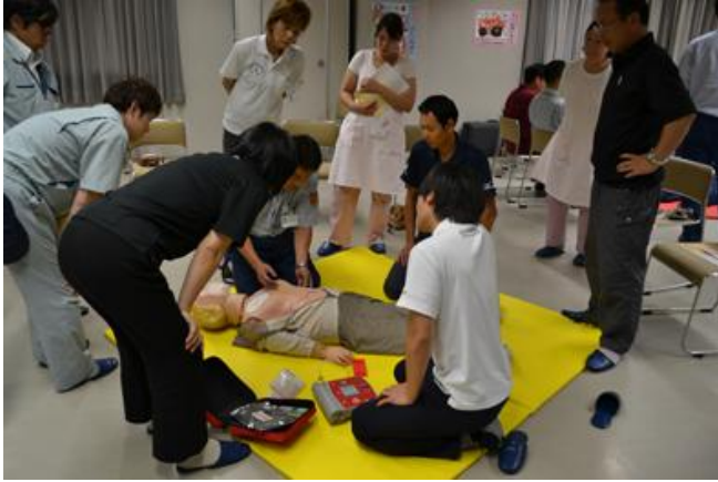
AEDのパッドを貼る場所を確認する