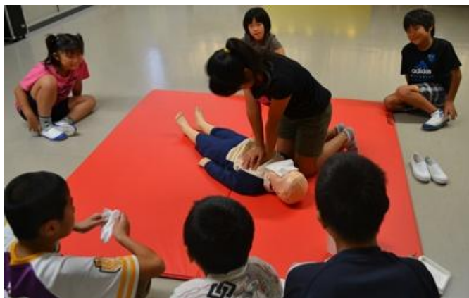
心肺蘇生法の実技