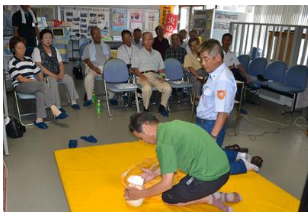
心肺蘇生法を学ぶ