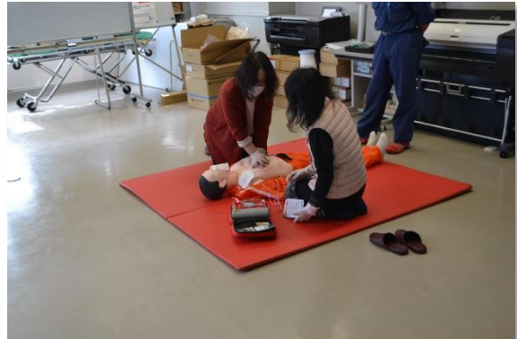
AEDを使った心肺蘇生法の実技