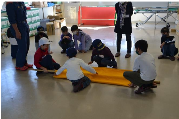
毛布と竹を使って担架づくり