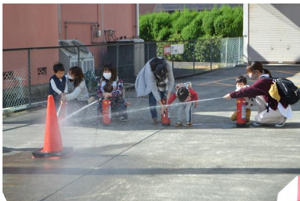
お母さんと一緒に消火体験