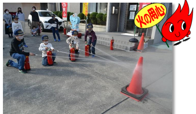
水消火器による消火体験