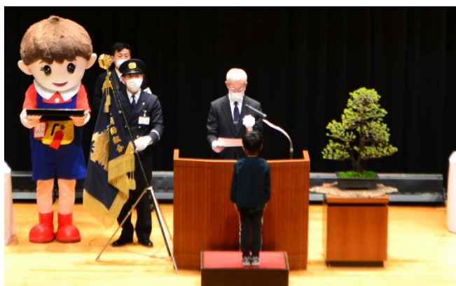
表彰状および記念品贈呈

令和4年12月10日(土曜日)10時から岩出市立市民総合体育館で令和4年度防災ひとづくり事業入賞者表彰式および作品展を開催しました。ご出席いただき、ありがとうございました。