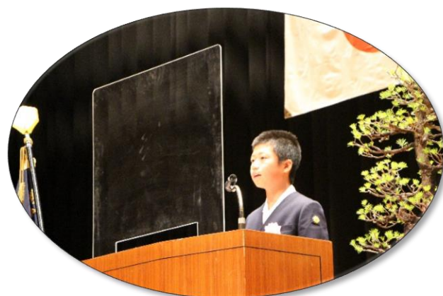
「子ども防災博士意見発表会」最優秀作品披露 「災害を正しく恐れよう」