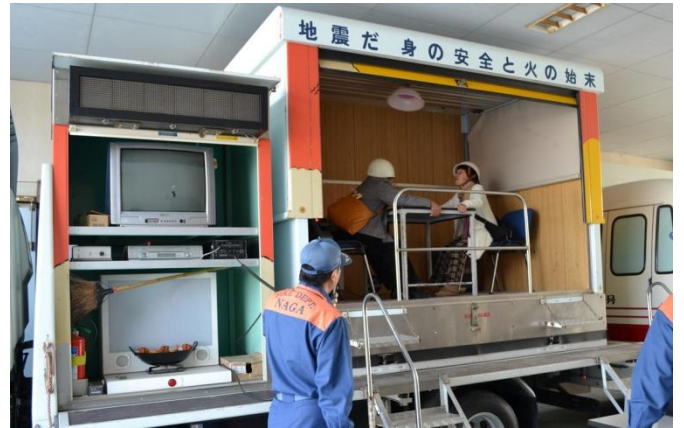
なまず号による地震体験