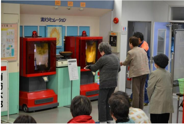
消火シミュレーションによる消火体験