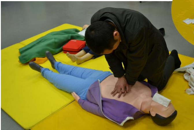
心肺蘇生法の実技