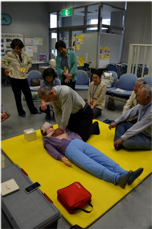
心肺蘇生法の実技

5月14日（木）15日（金） 保育園（所）の保育士 幼稚園・小中学校の教諭（普通救命講習会）