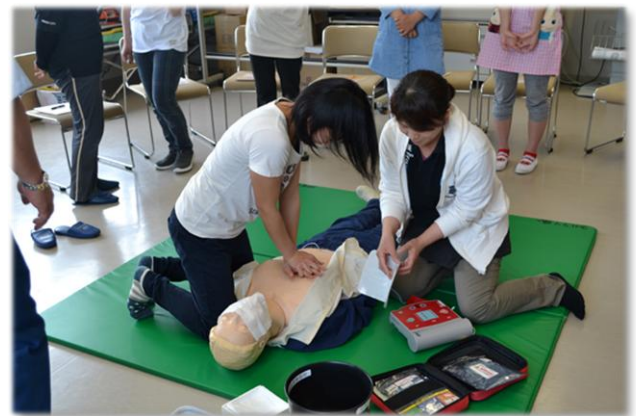
AEDを使用した心肺蘇生法の実技