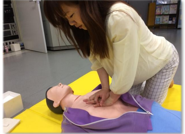
心肺蘇生法の実技