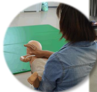
異物除去法の実技