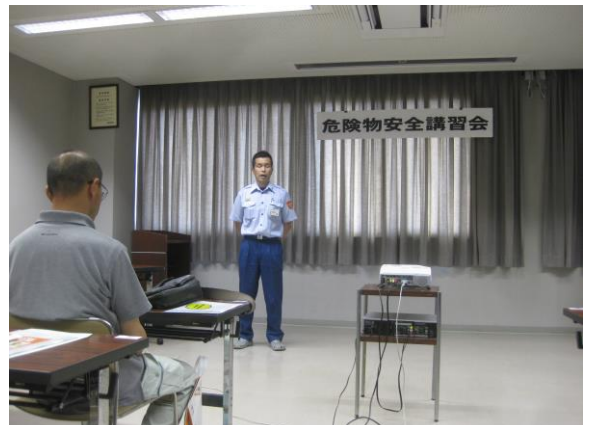
閉会のあいさつ（福井予防課長）