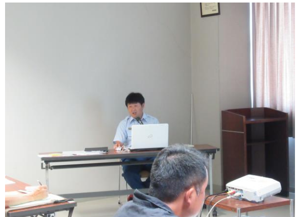
担当者からの講習