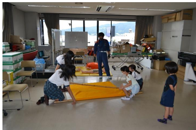
応急担架作成風景

心肺蘇生法の実技も一生懸命がんばったよ！くじをひいて景品と交換するゲームも楽しみました。