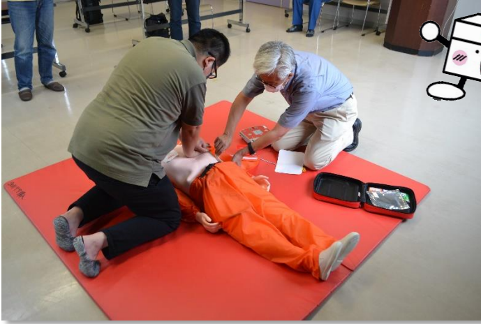
AEDを使った心肺蘇生法の実技