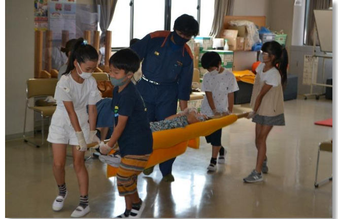
毛布と竿を使った搬送法を学ぶ

心肺蘇生法の実技も一生懸命がんばったよ！くじをひいて景品と交換するゲームも楽しみました。