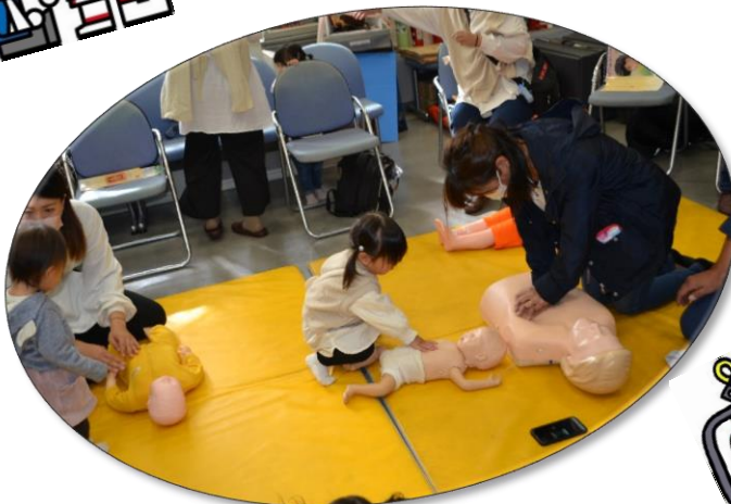
お母さんと一緒に胸骨圧迫！