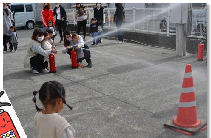
お母さんと一緒に消火訓練！