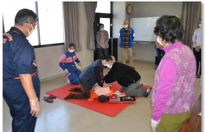
AEDを使った心肺蘇生法の実技