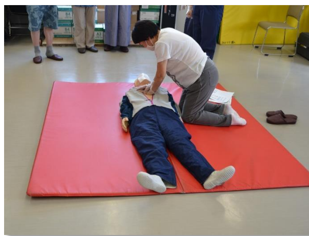
胸骨圧迫の実技風景