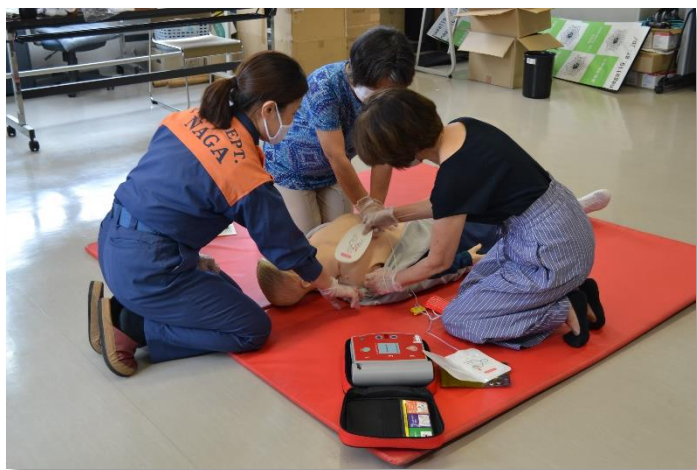
AEDを使った心肺蘇生の実技風景