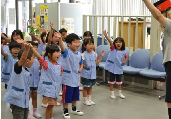
踊って学ぼう「じしんだーんだん」