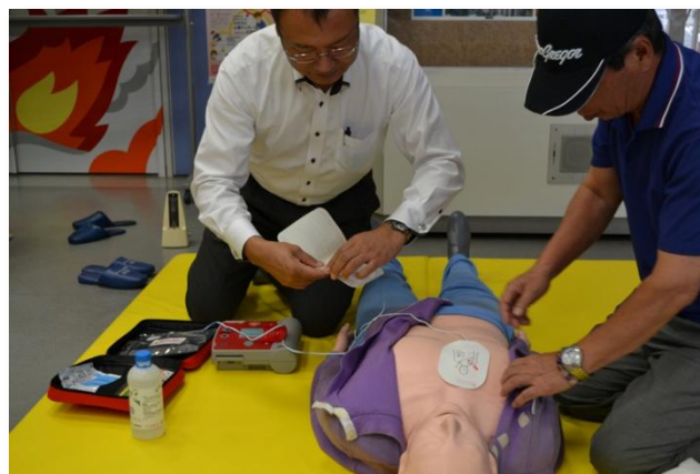
AEDを使った心肺蘇生法の実技