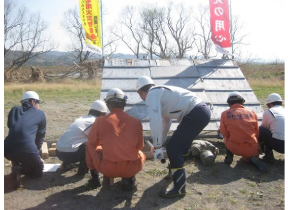
②模擬家屋からの救出訓練