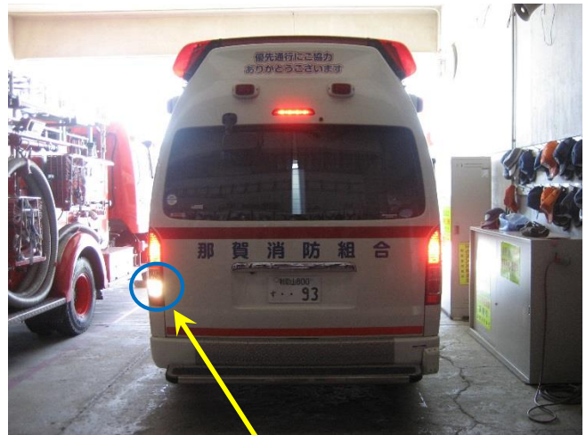
バックランプ点灯時（左側）

※現在の法令では、リヤフォグランプが1灯の場合は車体中央か車体右寄りに取り付けることとされています。