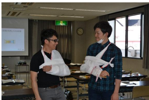
三角巾による応急手当 完成！

「救える命は救いたい」という思いで真剣に受講してくれました 8時間、お疲れ様でした。