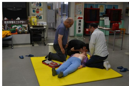
心肺蘇生の実技テスト