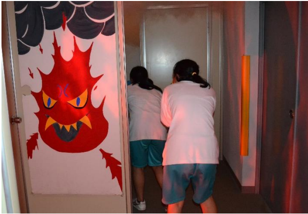
煙の中の避難体験

8月8日（火）、9日（水）岩出市の防災ジュニアリーダーのみなさんが育成講座の一環で防災センターを訪れ防災体験や普通救命講習会を受講しました。