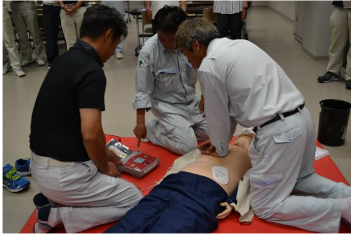
AEDを使った心肺蘇生法の実技