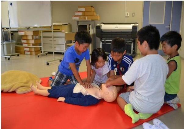
心肺蘇生法の実技

8月6日（日）8月27日（日）に子ども防災博士応急手当講座を開催しました。この講座は、管内の小学4年生以上の児童を対象に、応急手当の知識や技術を学ぶ講座です。