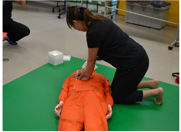
心肺蘇生法の実技

3人1組でAED・人工呼吸・胸骨圧迫と見事な連携プレーで 実技されていましたよ！