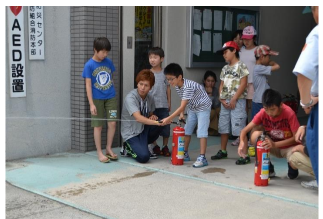
水消火器による消火体験