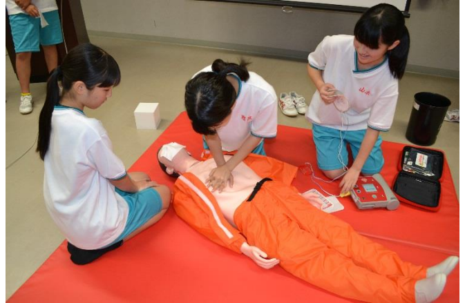
AEDを使った心肺蘇生法の実技