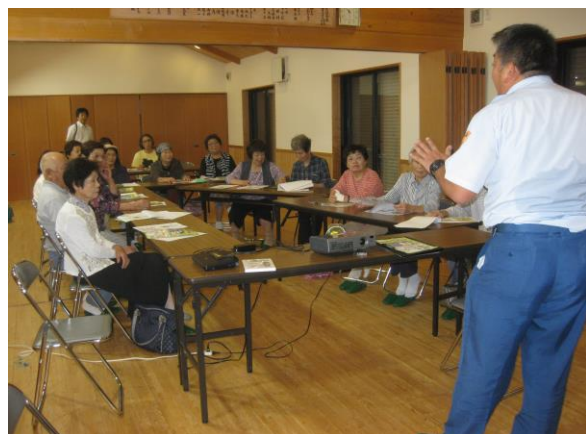
消防職員による防火講話