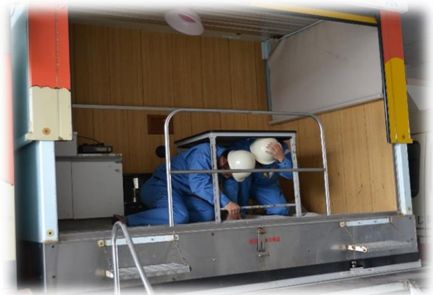
なまず号による地震体験

なまず号による地震体験や煙体験、119番通報体験を行いました。煙体験では、体験場所を暗くし、暗い状況での避難を体験しました。