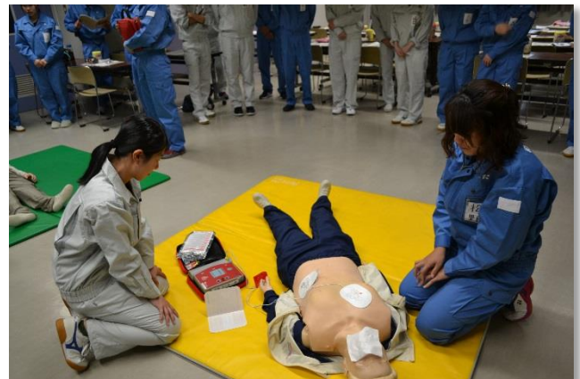
AEDを使った心肺蘇生の実技