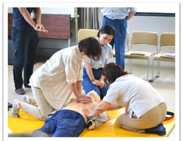
AEDを使った心肺蘇生法の実技