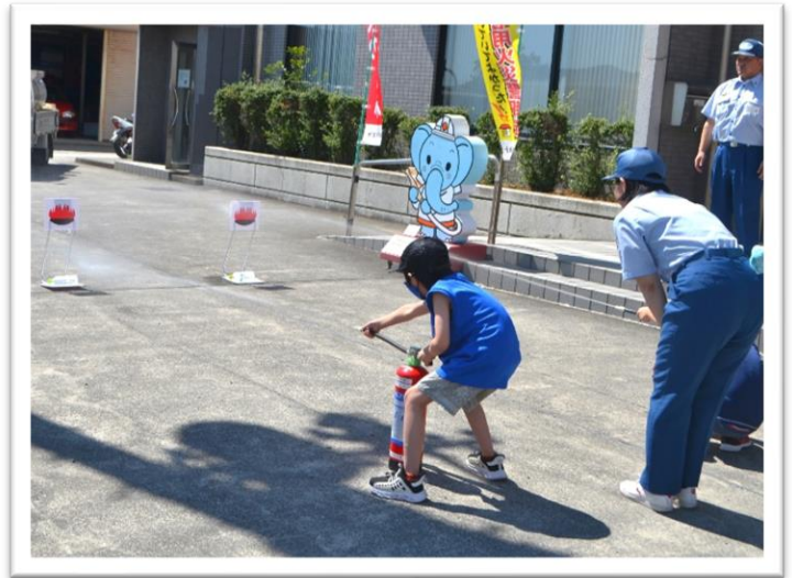
水消火器による消火体験