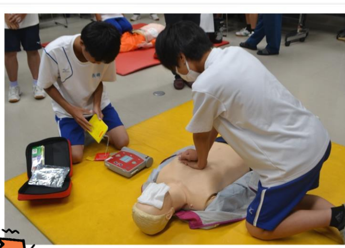
AEDを使った心肺蘇生法の実技