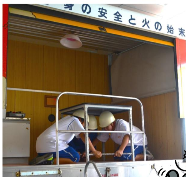
なまず号による地震体験

8月6日（火）・7日（水）、岩出市の防災ジュニアリーダーのみなさんが育成講座の一環で防災センターを訪れ防災体験や普通救命講習を受講しました！