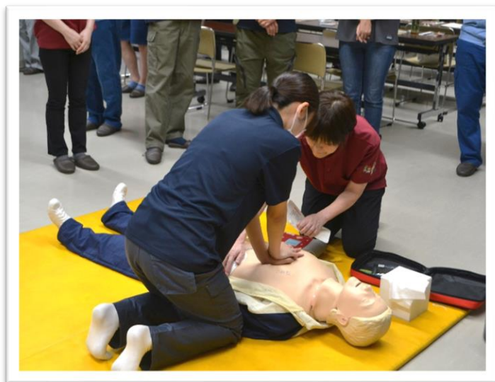
AEDを使った心肺蘇生法の実技