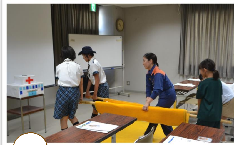
毛布を使った搬送法