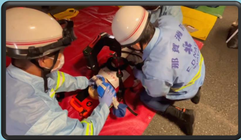
「自動心マッサージ器による 応急処置」