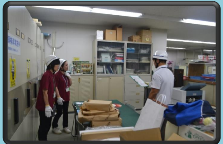
「自衛消防隊長から各隊員へ指示」