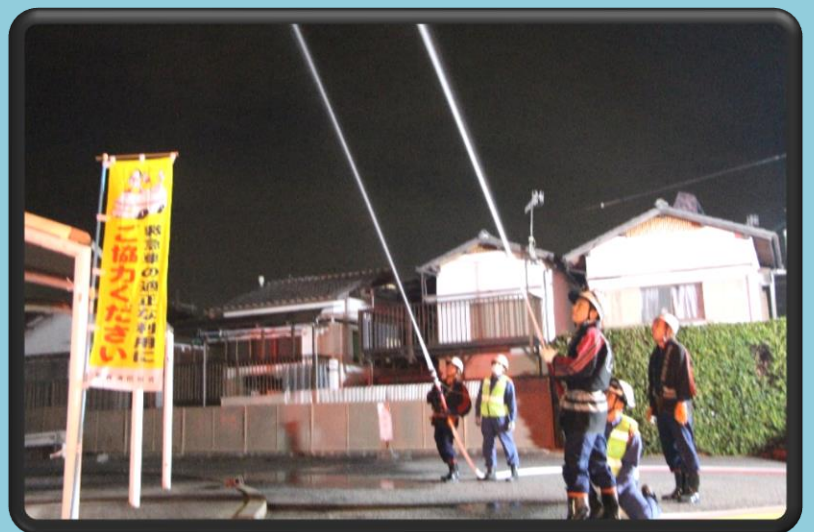
「消防団による放水」