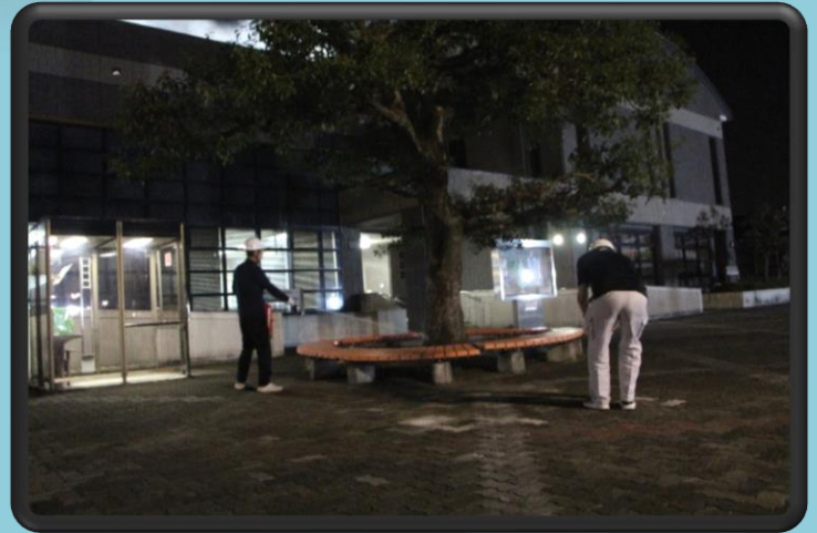
「応急救護所の様子」