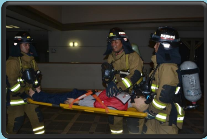
「消防隊に救出される要救助者」