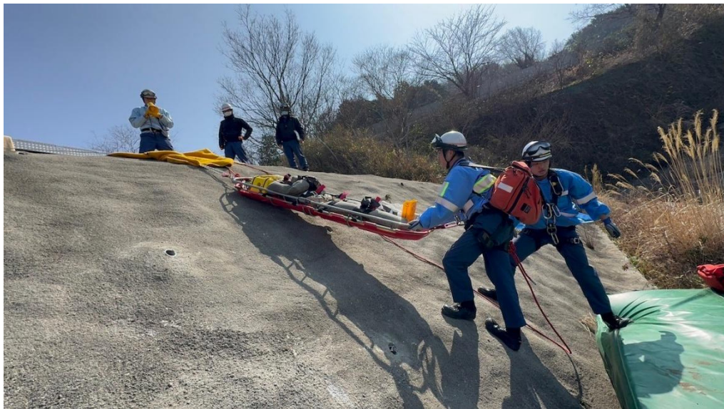
【「ロープレスキュー」システムによる救出活動中】