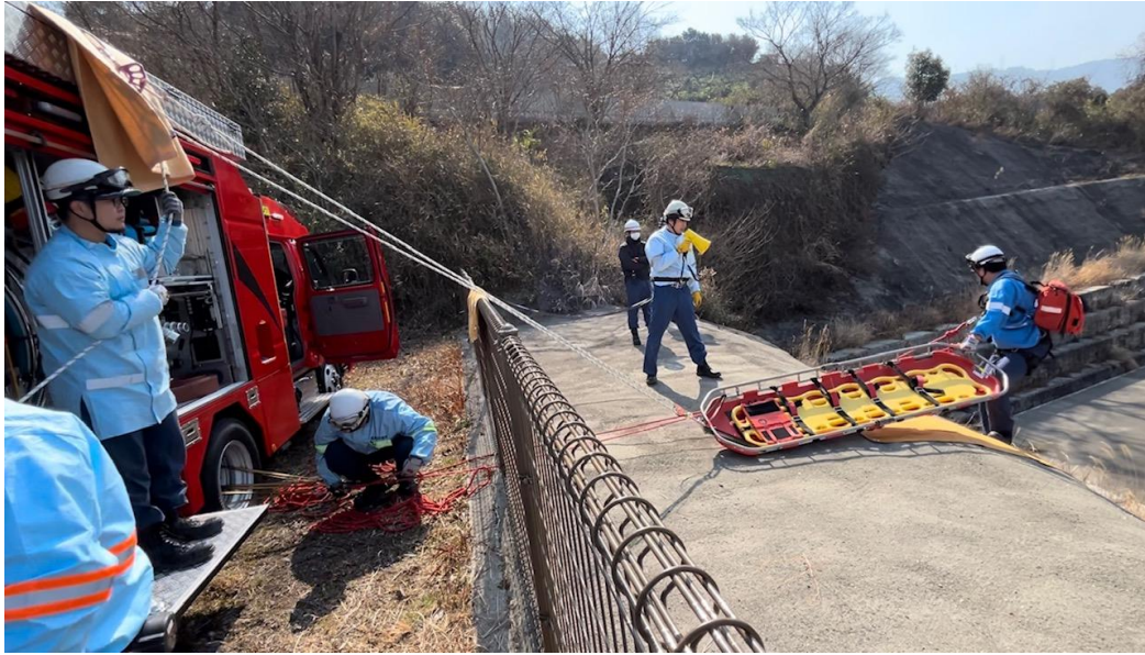
【「ロープレスキュー」システムによる救出準備】