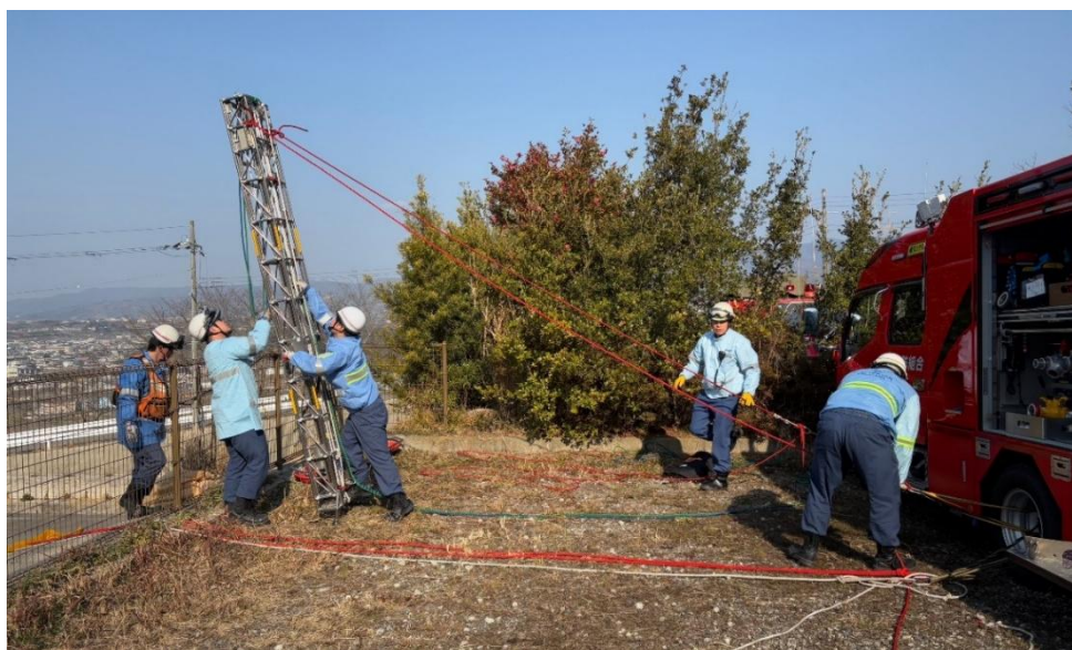
【三連梯子を使用した「梯子クレーン」システム】

東消防署では、令和7年2月27日（木）、那賀斎場跡地において、救出訓練を実施しました。この訓練は、傾斜地に滑落した要救助者を救出し、災害対応能力の向上を図ることを目的に実施したものです。当日は、三連梯子を使用した「梯子クレーン救出」とスタティックロープ（登山用ロープ）を使用した「ロープレスキュー」の2種類を実施し、自力歩行不能な要救助者を救出する技術の錬磨と、技術の共有を図り、有意義な訓練となりました。