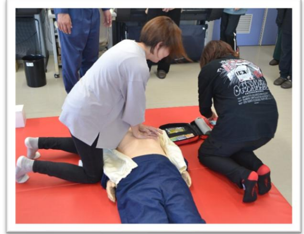
AEDを使った心肺蘇生法