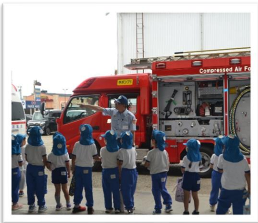
救急車・消防車の見学