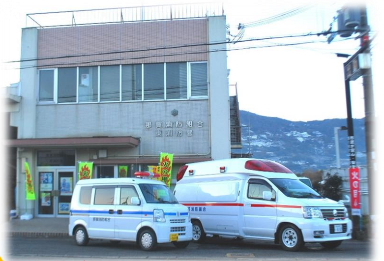
東 消 防 署