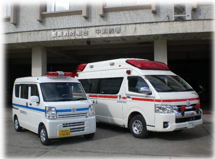
中 消 防 署