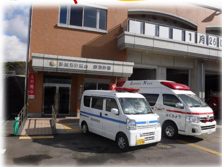
南 消 防 署

那賀消防組合では、中山間地や道路の狭い地域での災害対応として小型多目的搬送車（軽救急車）の導入を平成26年度から行ってきましたが、平成28年11月1日（火）をもって、中消防署（岩出市）東消防署・南消防署（紀の川市）の3署全てに配備が完了しました。