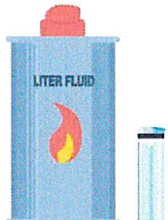
ライター・オイル