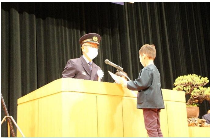
表彰状および記念品贈呈

令和5年12月2日(土曜日)10時から粉河ふるさとセンターで令和5年度防災ひとづくり事業入賞者表彰式および作品展を開催しました。 ご出席いただき、ありがとうございました。