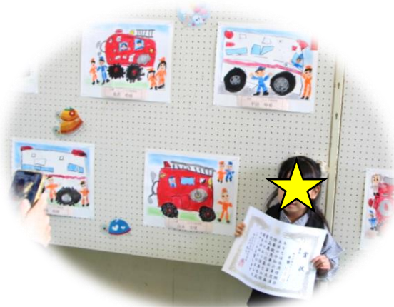
作品の前で記念撮影(^^♪