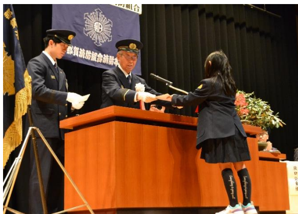
表彰状および記念品贈呈

令和6年12月7日(土曜日)10時から岩出市立市民総合体育館で令和6年度防災ひとづくり事業入賞者表彰式および作品展を開催しました。 ご出席いただき、ありがとうございました。