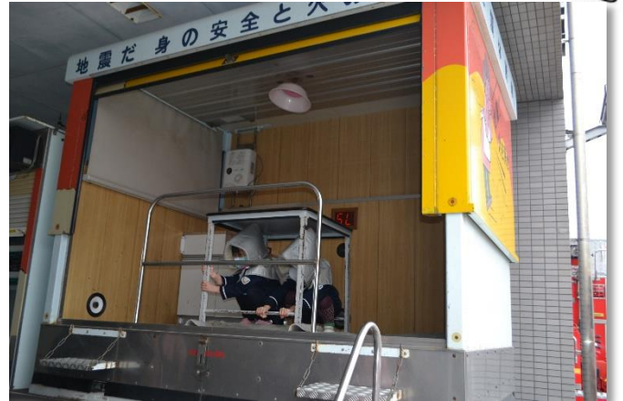
なます号による地震体験