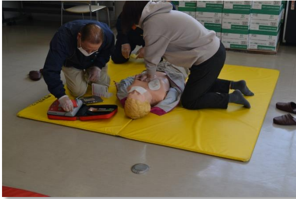
AEDを使った心肺蘇生法の実技